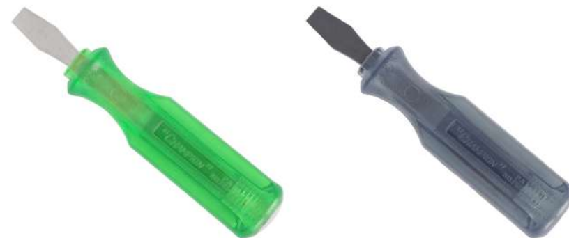
No.100S グリーン シルバー軸