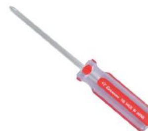
No.706 ⊕ 2×100