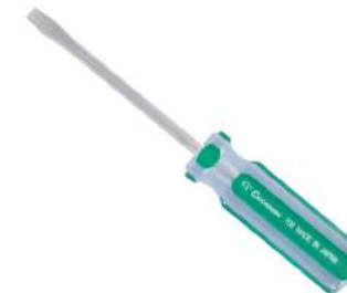
No.706 ⊖ 6.0×100