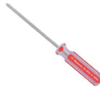
No.705 ⊕ 1×100