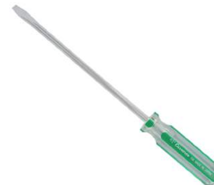
No.708 ⊖ 8.0×200