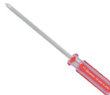
No.708 ⊕ 3×150