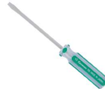
No.705 ⊖ 5.0×100