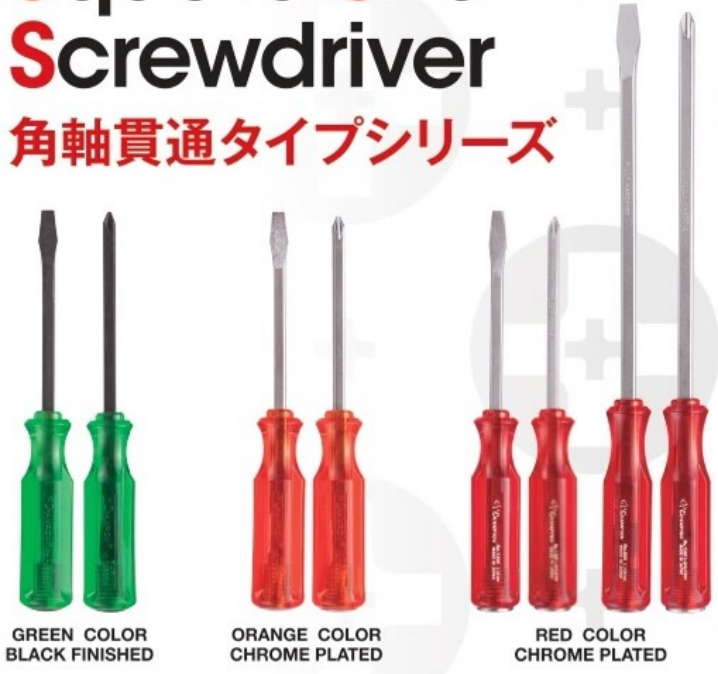
GREEN COLOR BLACK FINISHED