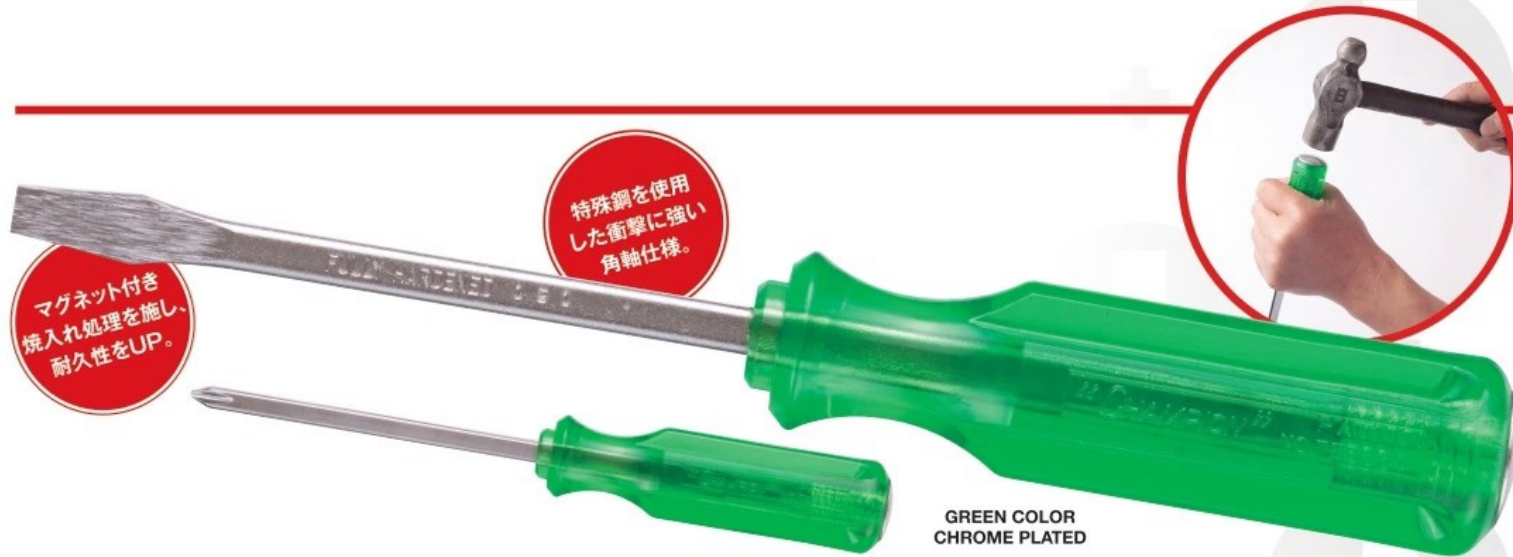
GREEN COLOR CHROME PLATED