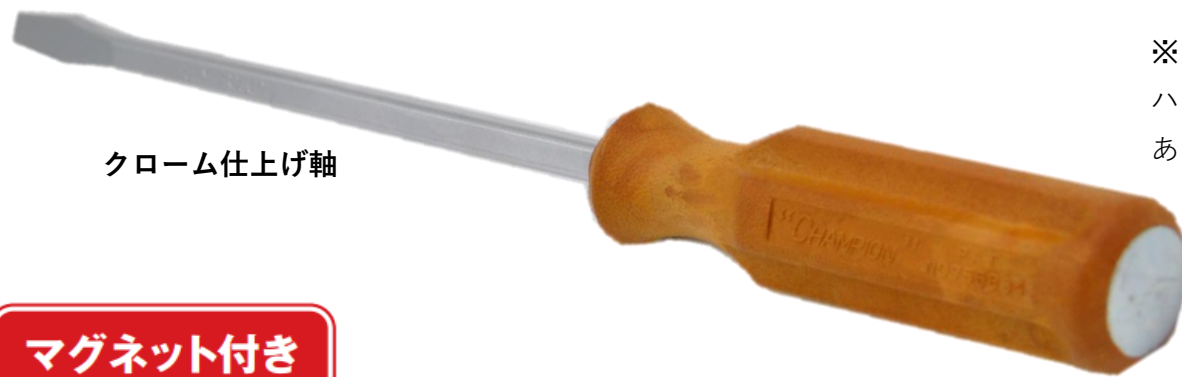
クローム仕上げ軸

※ハンマー等で上部から叩打する場合、ハンドルが割れる場合がありますのであくまでも補助としてお使い下さい。